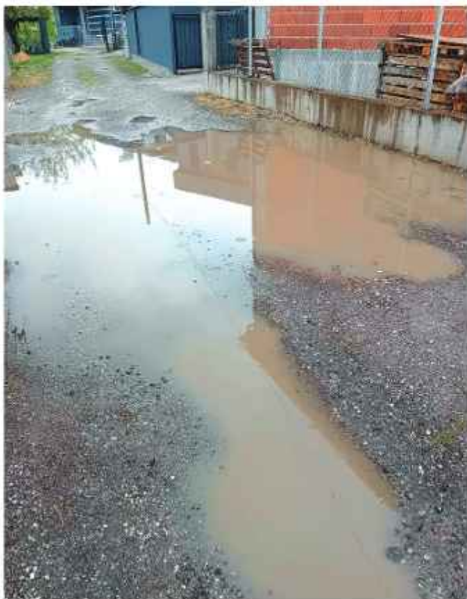
Еве како изгледа улица „18“ во скопската населба Инџиково. Колку години треба уште да се чека да се среди како што треба?