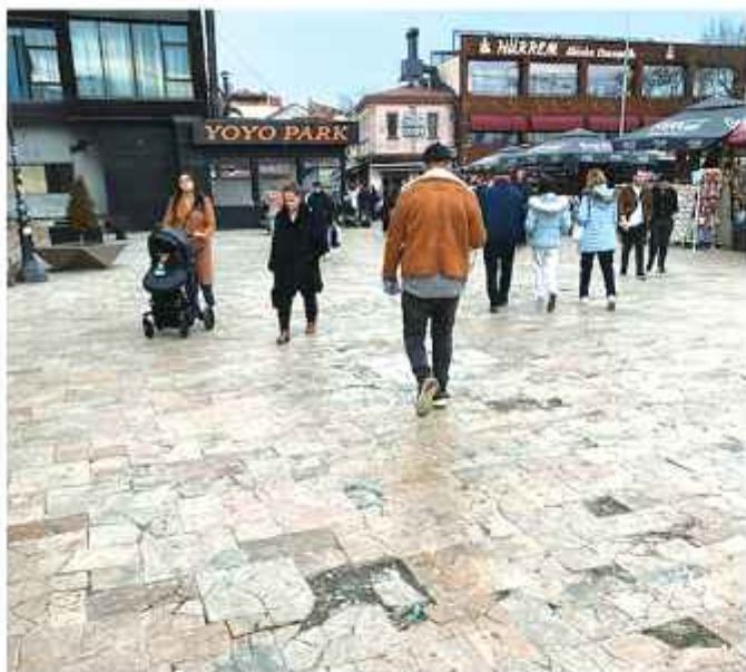
Влезот кон Старата чаршија е целосно руиниран од страната на Центар. Туристите што ќе си речат? Бранка