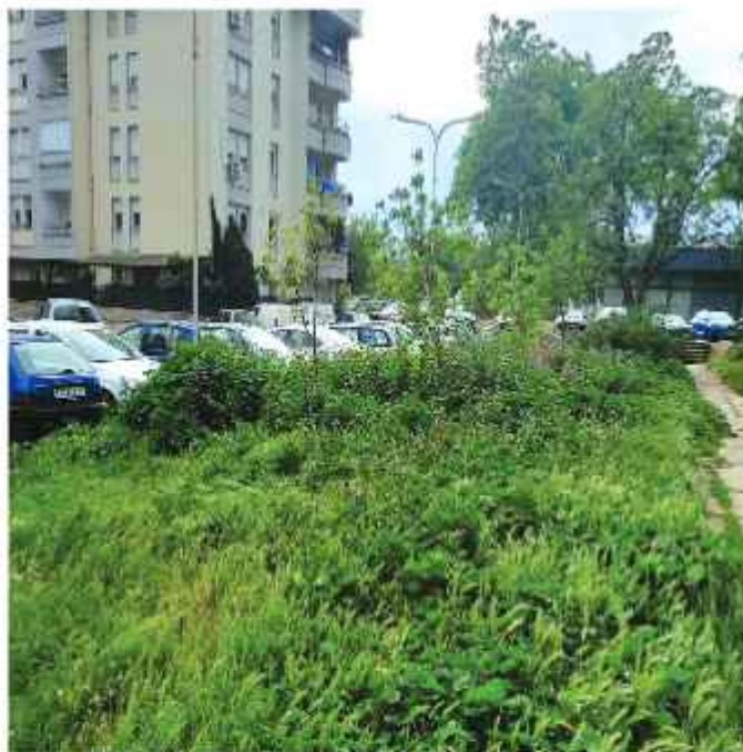
На улицата „Вич“ во општина Карпош тревата изгледа вака. Дали ќе се покоси не се зна. Можеби и ќе се чека да се исуши?