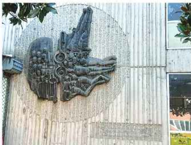
Еднаш ја пратив фотографијата и не реагираа надлежните. Ова е споменик на жртвите во НОБ кај Зелено пазарче. Нема натпис кому му е наменет, срамно е тоа.